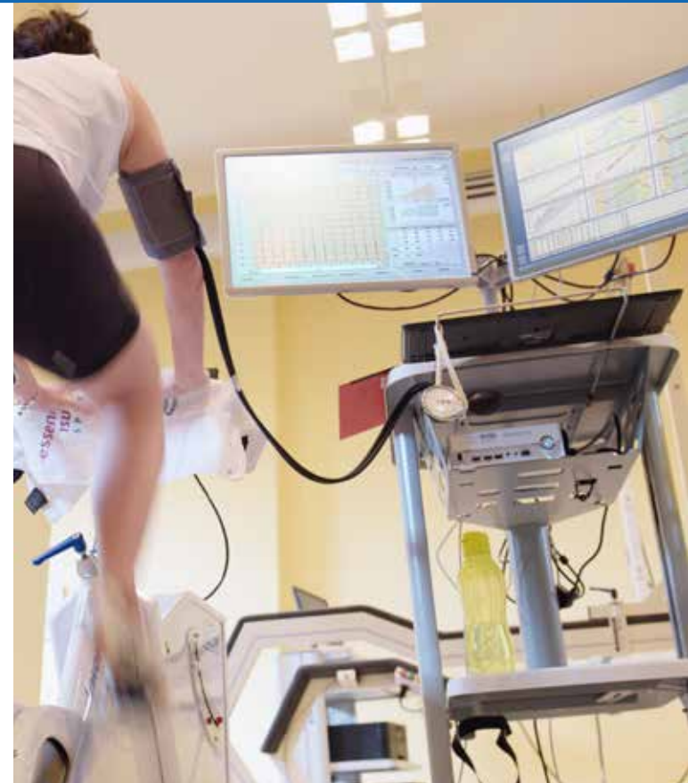
Design & Layoutplan © Charité; CV, Zentrale Medien dienstleistungen Charité

Fon 030 2093- 460 90 Fax 030 2093- 461 21 Email sportmedizin@charite.de