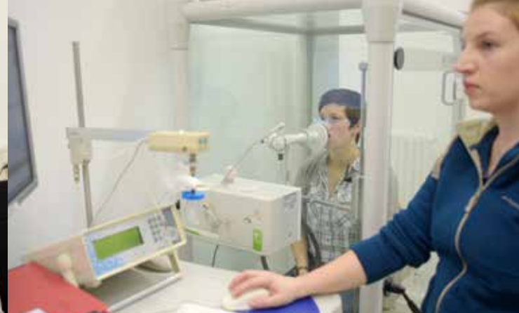
Internistische Sportmedizin Leistungsdiagnostik